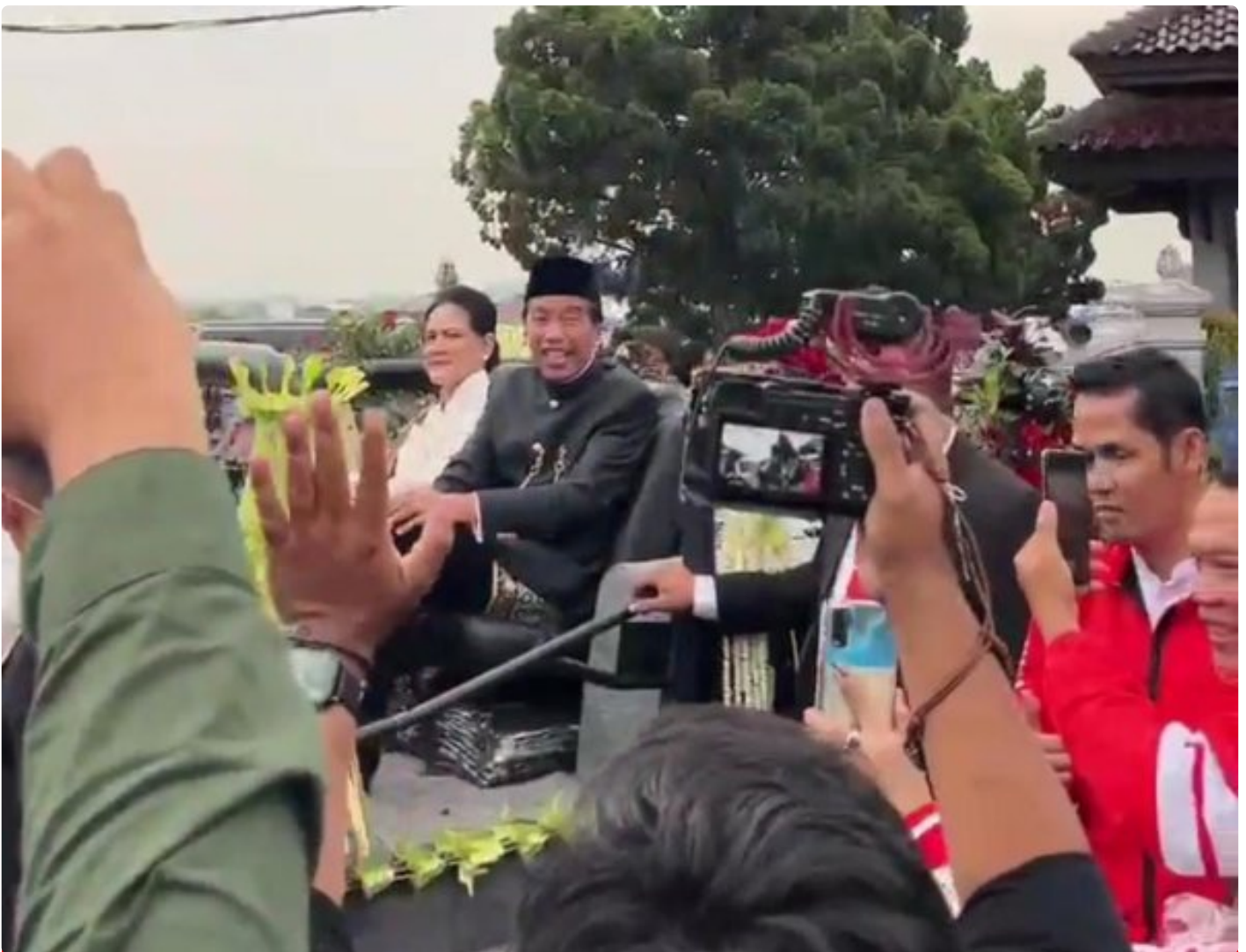
Foto: Antusiasme warga Solo memuncak saat mantan Presiden RI ke-7, Ir. H. Joko Widodo, kembali ke tanah kelahirannya pada Minggu, 20 Oktober 2024.

SURAKARTA- Antusiasme warga Solo memuncak saat mantan Presiden RI ke-7, Ir. H. Joko Widodo, kembali ke tanah kelahirannya pada Minggu, 20 Oktober 2024. Ribuan masyarakat dengan penuh semangat berkumpul di sepanjang rute